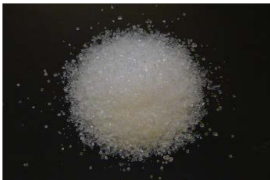
倍率 \times 1