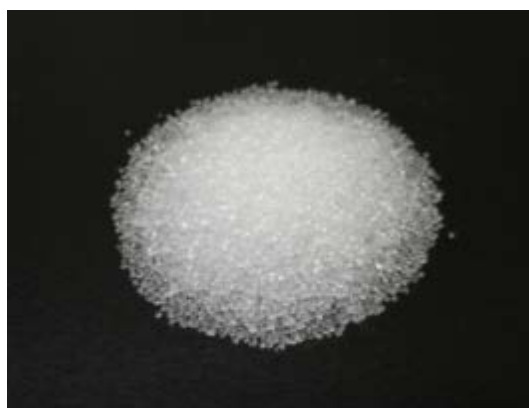
倍率 \times 1