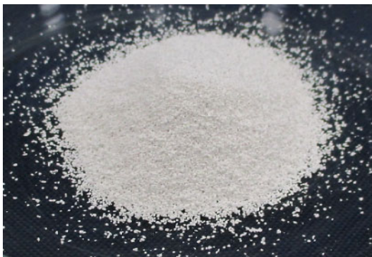
倍率 \times 1