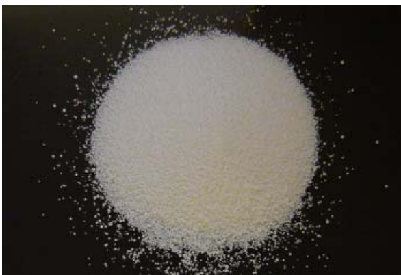
倍率 × 1